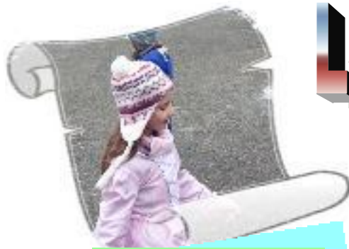
Le grand jour du Carnaval