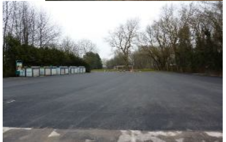
La place de dépôt des verres et cartons goudronnée

L'escalier de l'appartement a reçu lui aussi un coup de neuf. Les murs ont été repeints et les marches vernies.